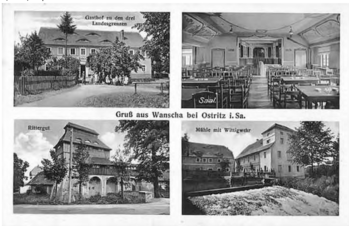
Gruß aus Wanscha bei Ostritz i. Sa.

Vesnice položená nad Smědou, se slovanskými kořeny. V nejstarších písemných zdrojích se dochovaly následující názvy tohoto místa: Wenschaw (1410, 1419, 1428), Wenschaw (1421), Wennyschaw (1427), Wansche (1429), Wenssche (1481). Později také Wendscha (1753) a před rokem 1945 - Wanscha.