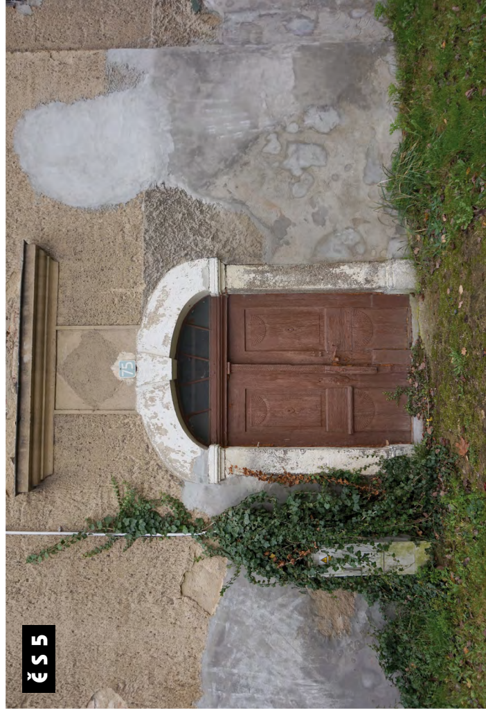
Č S 5