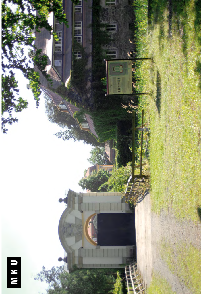
M K U