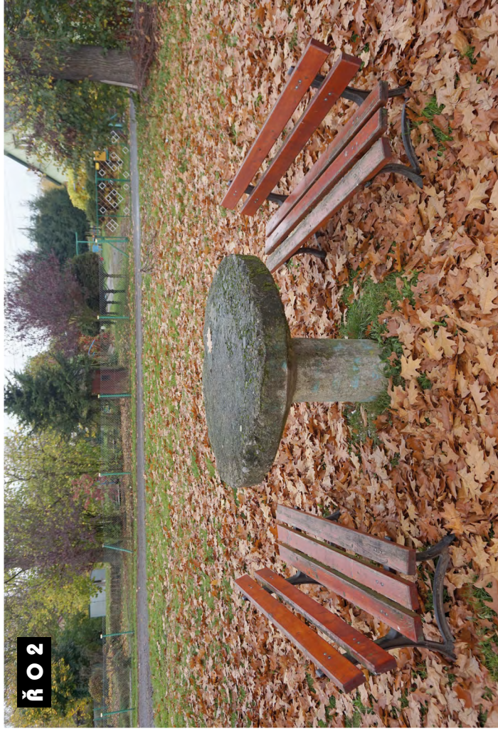
Ř O 2