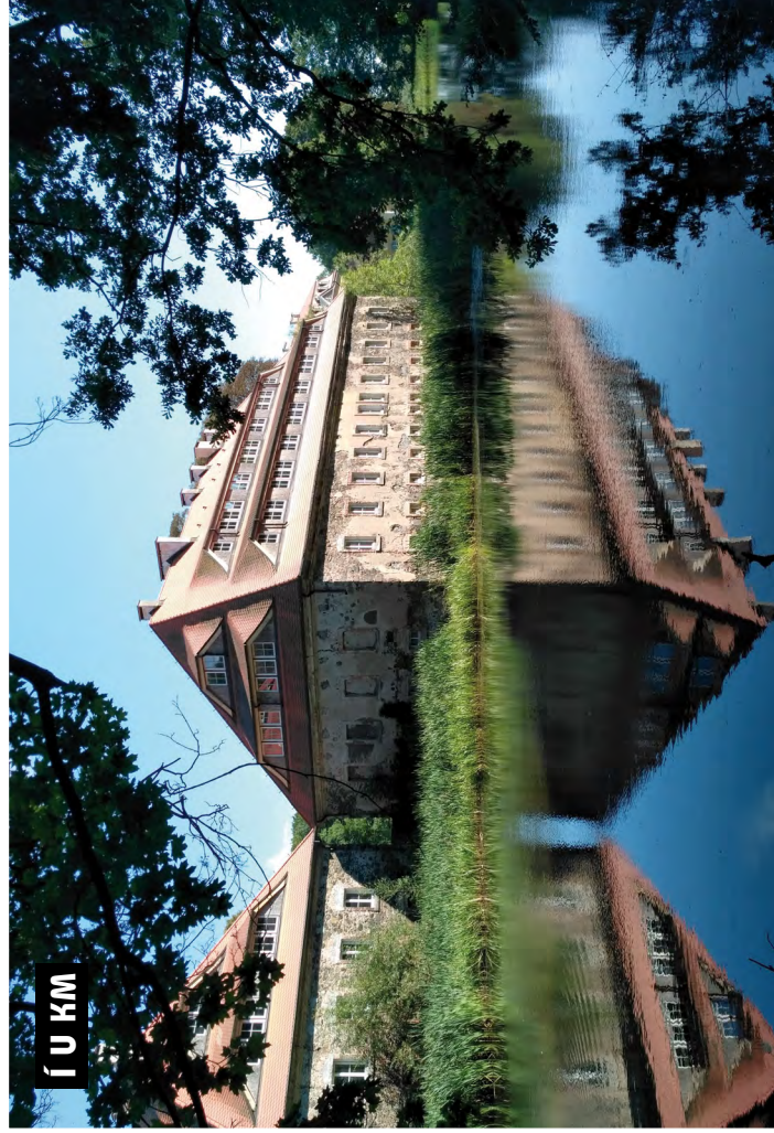
Í U K M