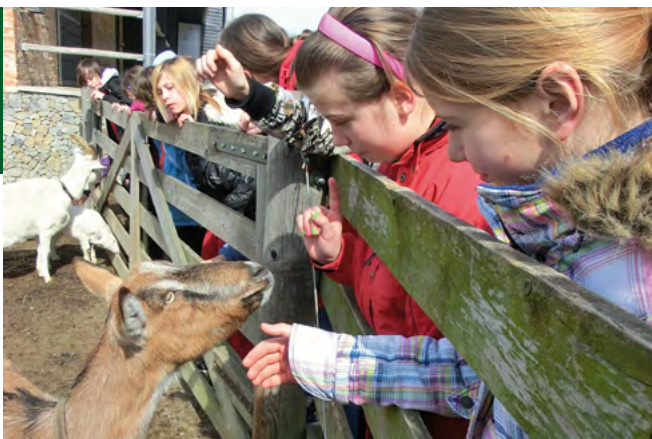
Zvířata chovaná v roce 2013

Výuková farma je součástí areálu ekocentra a byla vybudována pro potřeby ekologicko-výchovných programů. Návštěvníkům nabízíme setkání s některými hospodářskými zvířaty přímo v naší kontaktní ohradě. Na farmě chováme původní česká plemena: huculský kůň, koza bílá krátkosrstá, valašská ovce, přeštické prase, slepice česká zlatá kropenka. Tato plemena jsou zařazena do genových rezerv ČR. V roce 2013 se nám podařilo vylíhnout a odchovat 13 kuřat od našich slepic.